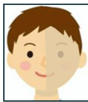
影ができています